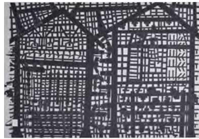
寺尾勝広 《今木+インカーブ鉄工所》 色鉛筆、厚紙 727×1080mm 2011 年