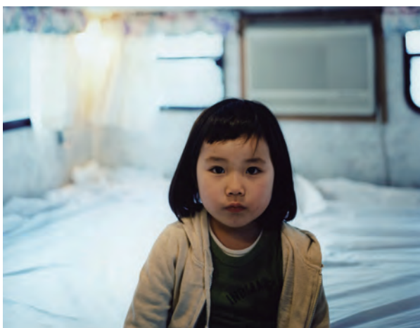
《Tokyo and My Daughter》より 2006