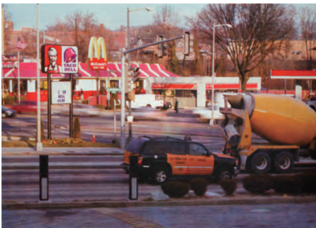
《M / Washington D.C.》2010